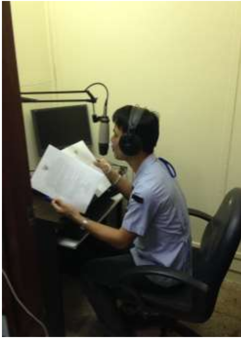
ประกาศเสียงตามสาย รพ.ชานุมาน