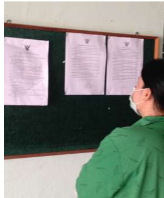
ประกาศบอร์ดประชาสัมพันธ์