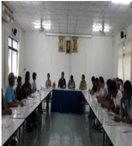
ประกาศนโยบายในระดับอำเภอชานุมาน

การจัดประชุมเผยแพร่นโยบายงานสุศึกษาและพัฒนาสุขภาพ ระดับชุม