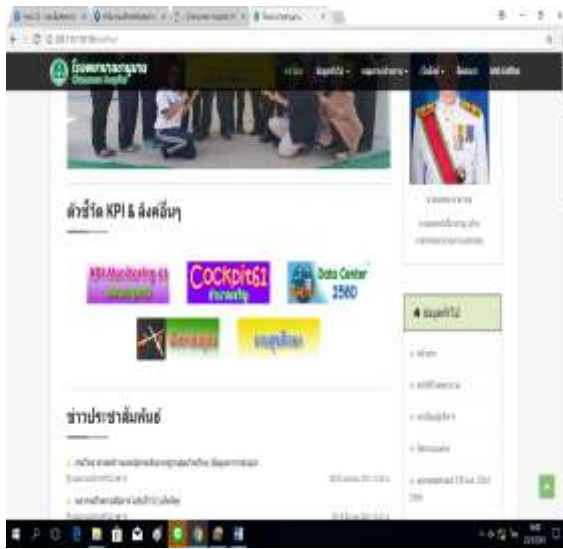
ประชาสัมพันธ์ เว็บไซต์โรงพยาบาล

การจัดประชุมเผยแพร่นโยบายงานสุศึกษาและพัฒนาสุขภาพ ระดับโรงพยาบาล