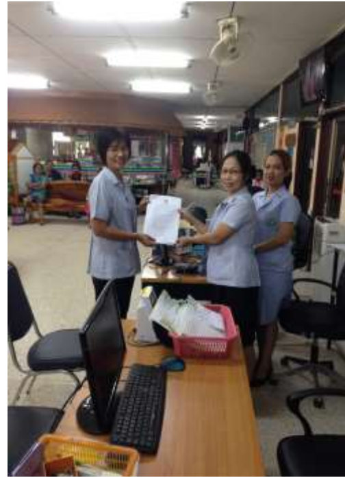
แจ้งหน่วยงานให้รับทราบลายลักษณ์อักษร

การจัดประชุมเผยแพร่นโยบายงานสุศึกษาและพัฒนาสุขภาพ ระดับชุม