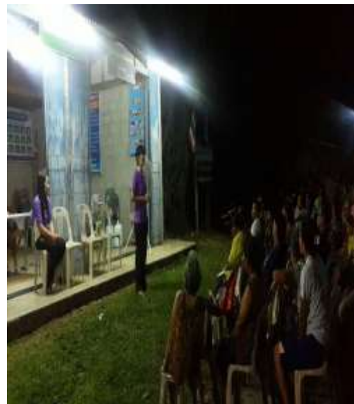
ประกาศนโยบายในระดับหมู่บ้าน